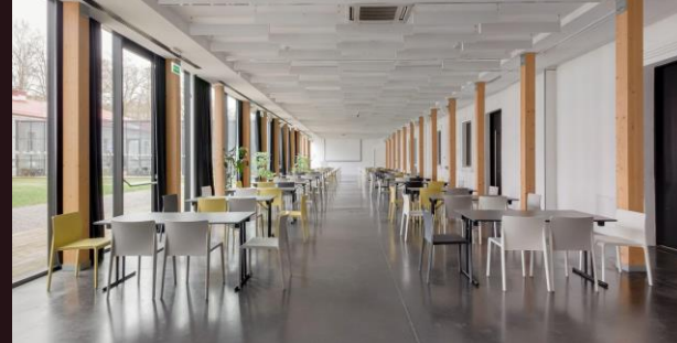
Dirbtuvių stiliumi (grupės po 4) | iki 175 asm.