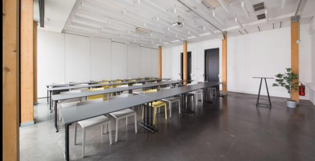
Klasės stiliumi (grupės po 2) | iki 40 asm.