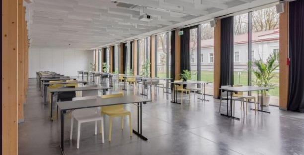
Klasės stiliumi (grupės po 2) | iki 120 asm.