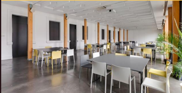
Grupės po 6-8 | Apvalių stalų vakarienės | iki 140 asm.