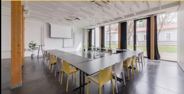
U-forma | iki 25 asm.