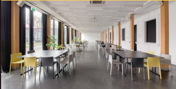
Grupės po 6-8 | Vakarienės | iki 180 asm.