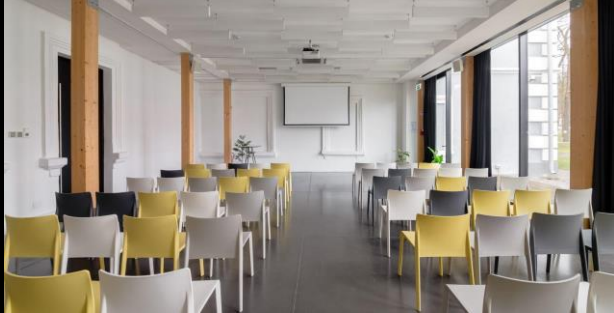
Teatro stiliumi | iki 70 asm.