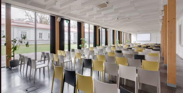
Teatro stiliumi | iki 190 asm.