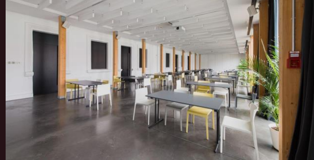
Dirbtuvių stiliumi (grupės po 4) | iki 120 asm.