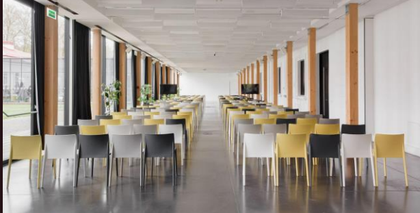
Teatro stiliumi | iki 300 asm.