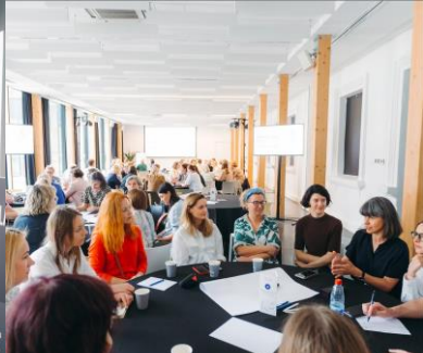
Mokymai | Hakatonai | Off-sites