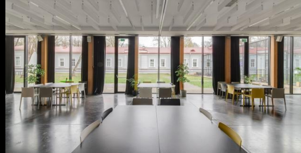
Dirbtuvių stiliumi (grupės po 4) | iki 30 asm.