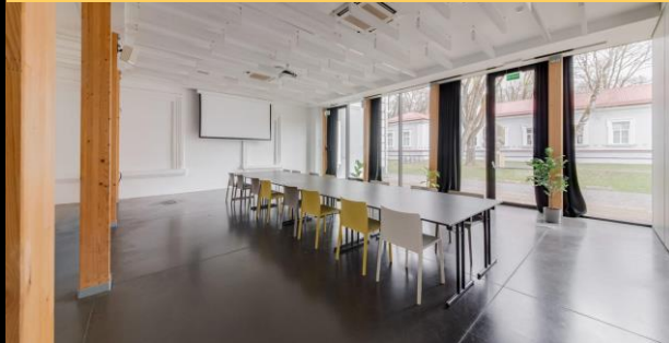
Posėdžių | iki 20 asm.