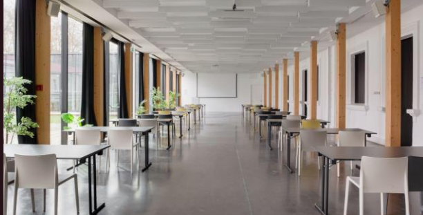
Klasės stiliumi (grupės po 2) | iki 200 asm.