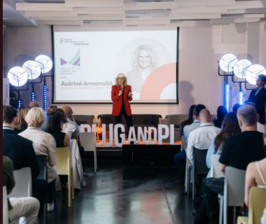
Konferencijos | Seminarai