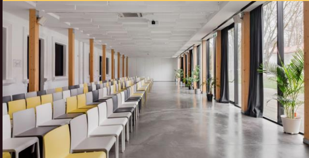
Teatro stiliumi (šonu) - iki 175 asm.